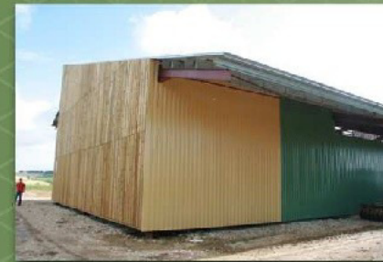
Bardage métallique vertical simple peau en façade Nord