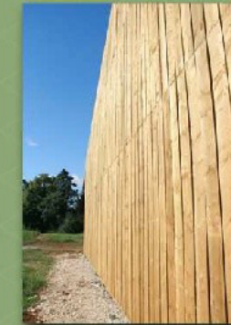
Bardage bois pose verticale à claire voie en pignon